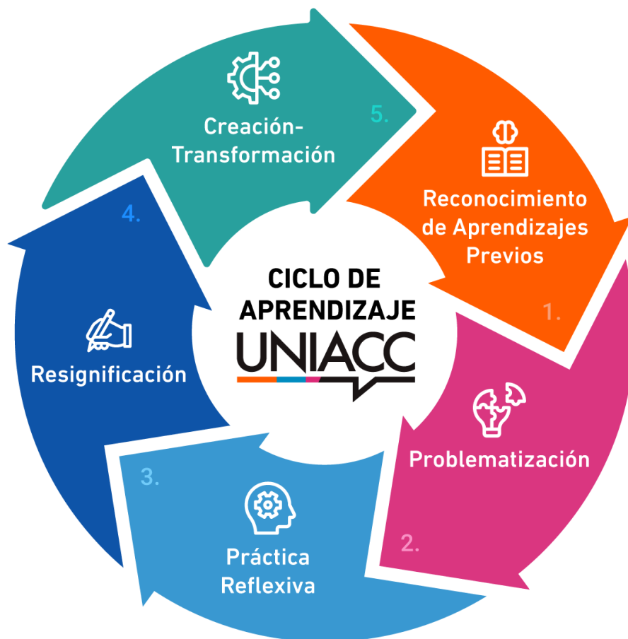
Ilustración 6: Ciclo de Aprendizaje UNIACC

Este ciclo expresa y operacionaliza el enfoque constructivista del Modelo Educativo UNIACC, al tiempo que proporciona una ruta pedagógica concreta para el diseño instruccional y la progresión de resultados de aprendizajes conducentes a los perfiles de egreso de las distintas carreras. A partir de esta visión, los procesos docentes deben estar diseñados para provocar activamente el tránsito por estas etapas, integrando metodologías pertinentes, acompañamiento efectivo y mecanismos de evaluación coherentes con los resultados de aprendizaje esperados.