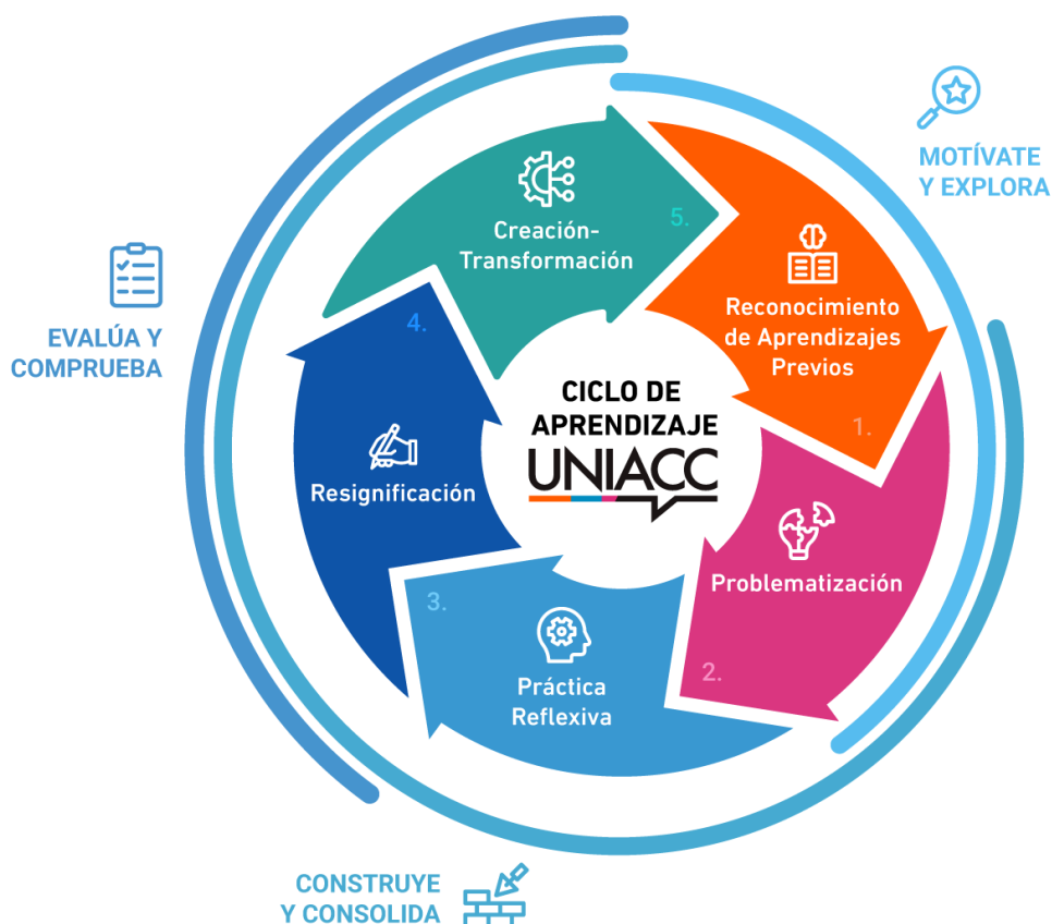
Ilustración 7: Ciclo de Aprendizaje UNIACC en Modalidad Online y Semipresencial

El diseño tecnopedagógico organiza trayectos formativos estructurados en torno a los resultados de aprendizaje, vinculando de forma intencionada recursos, actividades y metodologías específicas para cada momento del ciclo. Las actividades asincrónicas promueven la metacognición, la reflexión crítica y la autonomía estudiantil, a través de foros argumentativos, estudios de casos, proyectos colaborativos virtuales y trabajo individual. Estas instancias se complementan con momentos sincrónicos estratégicos, orientados a profundizar la comprensión, entregar retroalimentación oportuna y fortalecer el vínculo pedagógico.