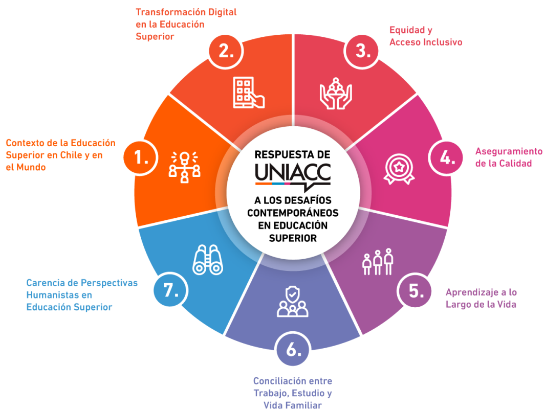
Ilustración 1: Contexto y Respuesta UNIACC