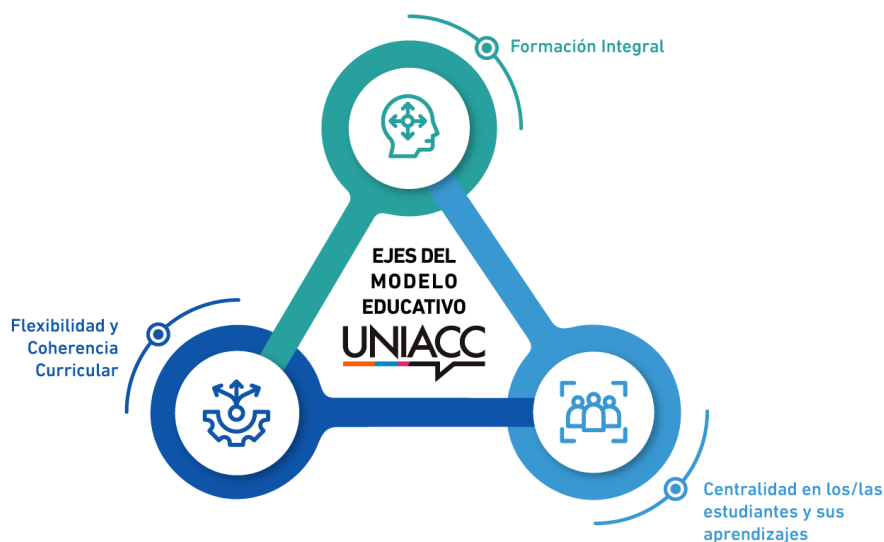
Ilustración 4: Ejes del Modelo Educativo

Al integrar flexibilidad con coherencia, UNIACC promueve un diseño curricular centrado en el estudiante, que permite avanzar de manera significativa a lo largo de su trayectoria, en todas las jornadas y modalidades. De esta manera, responde a los desafíos contemporáneos de la educación superior, asegurando la accesibilidad, calidad, pertinencia, equidad y continuidad formativa en los procesos de enseñanza y aprendizaje.